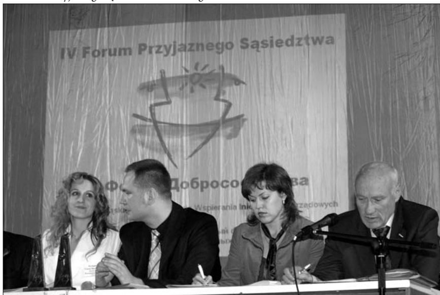
IV Forum Przyjaznego Sąsiedztwa w Kaliningradzie