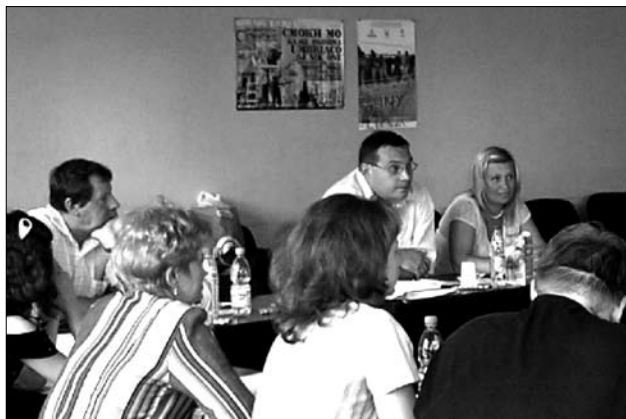
Nawet imprezy hip-hopowe muszą zacząć się od dobrej organizacji i poważnych rozmów

rzy festiwalu, uczestnicy promo-grupy „PROmashine”. – Zorganizowaliśmy tą imprezę, żeby pokazać, kim jesteśmy i zapoznać naszą młodzież z rapowymi zespołami z innych miejscowości i krajów. Ale do zrealizowania tej idei potrzebne były niemałe pieniądze, których raperzy nie posiadają. Pomogło nam Kaliningradzkie Centrum Wspierania Inicjatyw