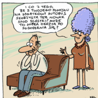
autor - Karol Kalinowski

Realizację konsultacji społecznych – pierwszego budżetu partycypacyjnego w Olsztynie można uznać za udaną. Chyba żadna z osób pracujących przy OBO nie spodziewała się takiego zaangażowania mieszkańców. Z jednej strony bowiem mamy w Olsztynie bardzo niski poziom kapitału społecznego, a z drugiej, czas wyznaczony na zorganizowanie procesu był bardzo krótki. Właściwie od samego początku nastawialiśmy się na to, iż pierwsza edycja Olsztyńskiego Budżetu Obywatelskiego nakierowana będzie raczej na wdrażanie się, naukę i niwelowanie początkowych błędów. Mieliliśmy i nadal mamy świadomość, że wypracowanie sprawnie i w miarę bezbłędnie przebiegającego procesu potrwa prawdopodobnie 2–3 lata. Nie można bowiem zapominać, że formuła budżetu obywatelskiego dopiero się w Polsce tworzy i nie ma jednego, wzorcowego szablonu, który można zastosować w każdej polskiej gminie. Pomimo początkowych oporów, słusznym