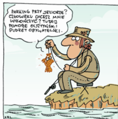
autor - Karol Kalinowski

Akcja informacyjno-edukacyjna, wspierająca konsultacje społeczne, opierała się na kilku tysiącach ulotek objaśniających 4 kroki Olsztyńskiego Budżetu Obywatelskiego, plakatach zapowiadających spotkania i ogłoszeniach medialnych. Uruchomiono stronę internetową www.decdujemy.olsztyn.pl , profil na facebooku, a na Platformie Konsultacji Społecznych stworzono