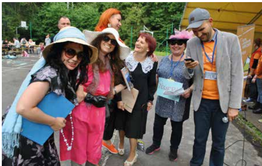
Forum Inicjatyw Lokalnych 2014 organizowane przez RO EFS

Klienci Regionalnych Ośrodków EFS mogli liczyć na wsparcie w następujących zakresach tematycznych: możliwości pozyskiwania środków, kwalifikowalności kosztów w EFS, procedur raportowania i rozliczania projektów w PO KL, monitoringu, procesu kontroli projektów PO KL, a także zasady równouprawnienia kobiet i mężczyzn w projektach PO KL, zasad realizacji projektów innowacyjnych i współpracy ponadnarodowej, pomocy publicznej, zamówień publicznych, finansów publicznych w projektach EFS itp .