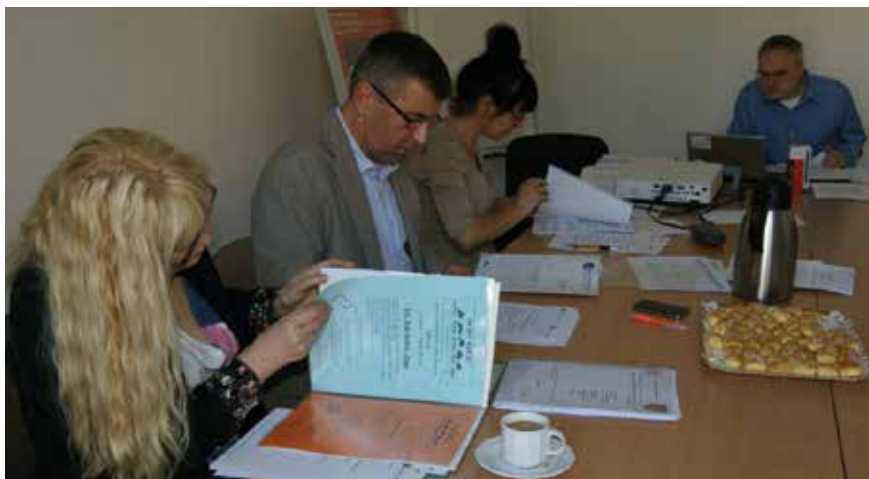
Jury Godni Naśladowania 2014

Ponadto przyznano wyróżnienie dla Gminy Miejskiej Bartoszyce oraz Powiatu Bartoszyce za współpracę w zakresie aktywizacji osób niepełnosprawnych (partnerstwo Miejskiego Ośrodka