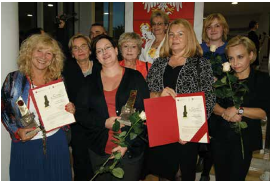
Gala Godni Naśladowania 2014

Za nami XI już edycja konkursu „Godni Naśladowania” którego ideą jest promowanie najlepszych inicjatyw organizacji pozarządowych i ich reprezentacji oraz samorządów w zakresie współpracy z III sektorem. Konkurs organizowany jest rokrocznie przez Radę Organizacji Pozarządowych Województwa Warmińsko-Mazurskiego pod honorowym patronatem Marszałka Województwa Warmińsko-Mazurskiego.