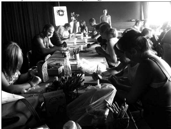
Uczestnicy warsztatów „Przełamać ciszę”, Elbląg

Elbląski projekt potrwa do końca br. W programie kolejne działania: warsztaty artystyczne, szkolenie w Zielonogradsku oraz konferencja dot. arteterapii. Projekt realizowany jest we współpracy z organizacjami pozarządowymi „Ruczejok” i „Nadieżdża” oraz szkołą dla dzieci głuchych z Zielonogradska. Współfinansowany ze środków Polsko - Amerykańskiej Fundacji Wolności w ramach Programu Przemiany w Regionie RITA za pośrednictwem Fundacji Edukacja dla Demokracji.