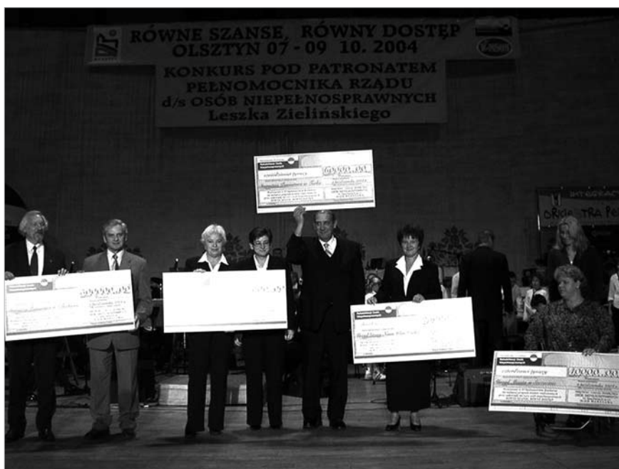
Gala – nagrodzone samorządy

W 2001 roku Sejmik pomógł w powołaniu Centrum Informacyjno-Szkoleniowego. Celem działania cen-