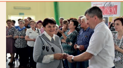
INAUGURACJA W CEKCYNIE

Patroni Honorowi naszych pro-seniorskich projektów: