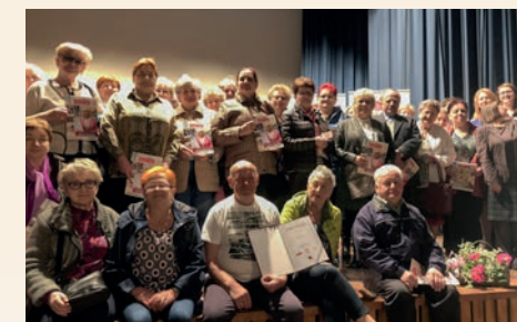
INAUGURACJA W GRYBOWIE