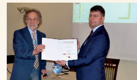
INAUGURACJA W BOLESŁAWIU

Nasze Stowarzyszenie wspiera i daje narzędzia niezbędne do współtworzenia Programu Gmina Przyjazna Seniorom. Pomożemy wprowadzić wszystkie elementy Programu w Państwa samorządzie.