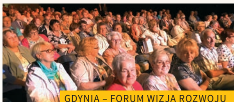
GDYNIA – FORUM WIZJA ROZWOJU

Ludzie po 60-tce coraz chętniej wychodzą poza stereotypy i mogą stać się cennymi odbiorcami oferty dotyczącej zdrowia, turystyki oraz kultury.